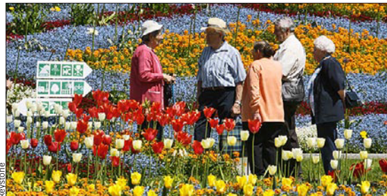
Zufrieden im Alter dank der richtigen Vorsorgestrategie.

Viele Anleger machen sich nur am Jahresende Gedanken über ihre Spar Guthaben der 3. Säule. Dabei ist es möglich, auch während des Jahres einen Teil der abzugsfähigen 6365 Franken anzulegen oder die Guthaben zu verschieben. Die Auswahl an Finanzprodukten für die steuerbegünstigte Vorsorge wird immer grösser. Ganz neu bietet die Bank Lienhardt & Partner zusammen mit der Liberty 3a Vorsorgestiftung unter dem Namen «Trestar» ein 3a-Produkt an, das in ETF (Exchange Traded Funds) investiert.